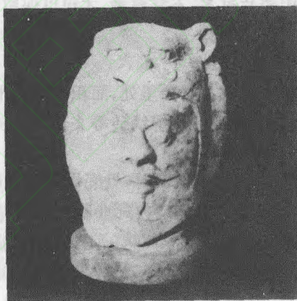
军粮城唐墓出土的武士俑