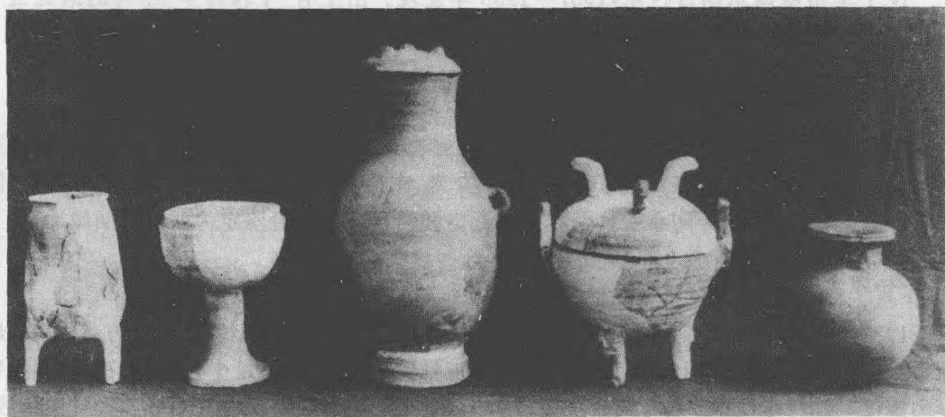
张贵庄战国墓出土的陶器