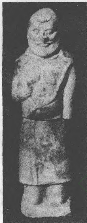
军粮城唐墓出土的胡俑