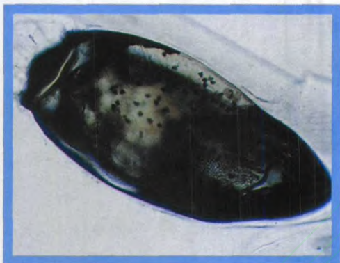
图150 含有幼虫的 阴虱卵