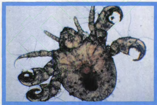
图151 阴虱有三对 足，前足细长， 其余两对足有钩形 巨足